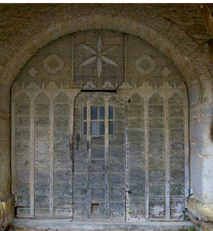
▲ La très belle porte de la grange de l'ancien presbytère

L'église de Montrond, après celle d'Amancey, présente un nouvel exemple d'édifice construit dans le cours du 19 e siècle, mais dans cette commune tout aussi désargentée, les solutions mises en œuvre sont très différentes.