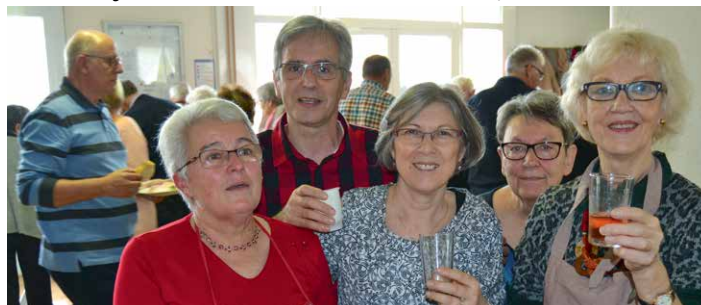
▲ À votre bonne santé !