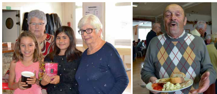
▲ Tous les âges étaient là.

Le repas paroissial d'Amancey du 5 novembre a réuni 180 personnes à la colo de Bolandoz, dans une bonne ambiance.