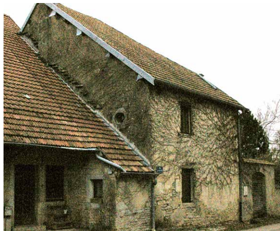
▲ La maison acquise en 1829 pour servir de presbytère.