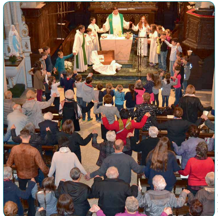
▼ Le moment du Notre Père à l'église de Bolandog le 5 novembre 2017.