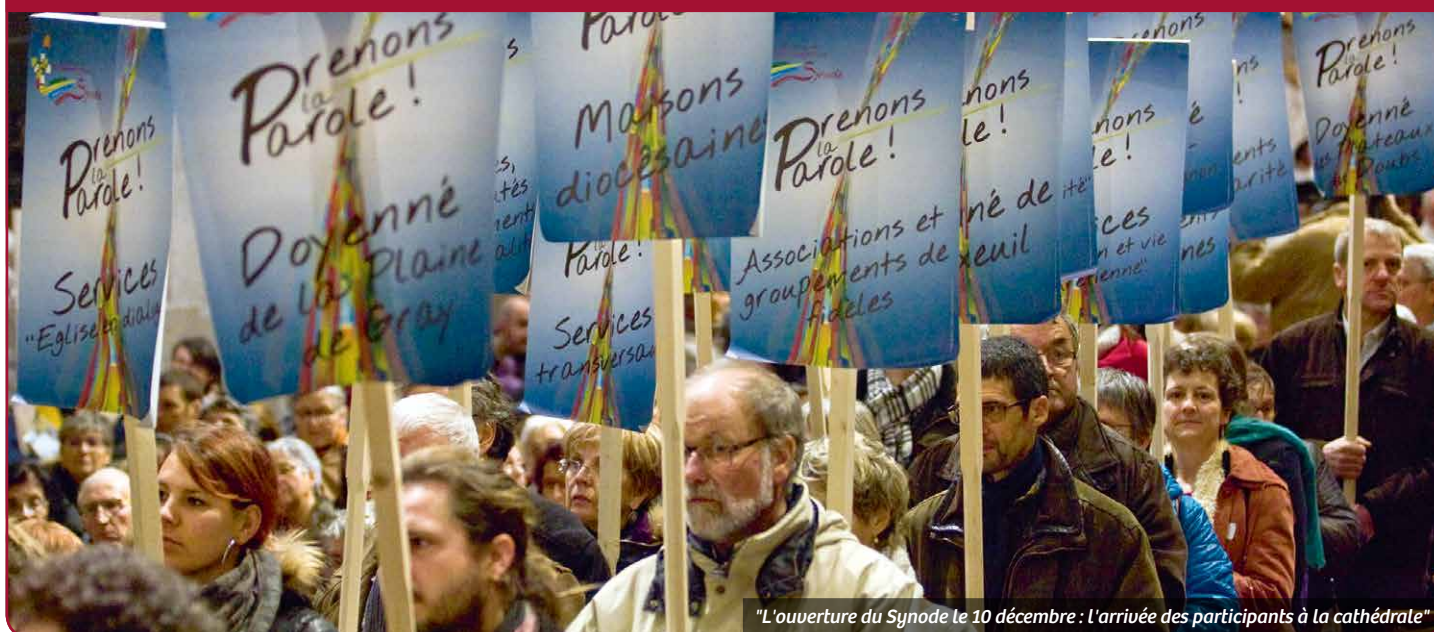
"L'ouverture du Synode le 10 décembre : l'arrivée des participants à la cathédrale"