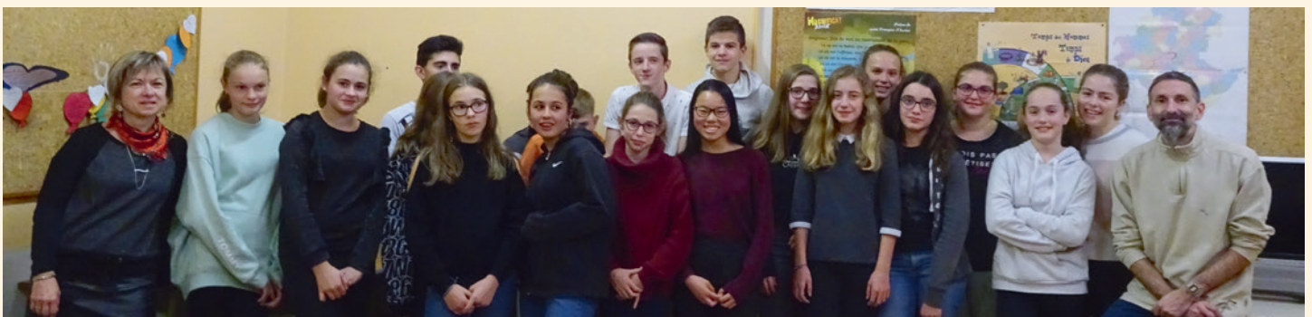
La Pasto Ados 2018-2019 Haute Vallée de la Loue, à la séance du vendredi 23 novembre à Ornans.

> Prochaines rencontres des équipes Pasto Ados: voir agenda jeunes p.14