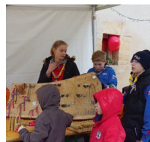
Le stand des scouts