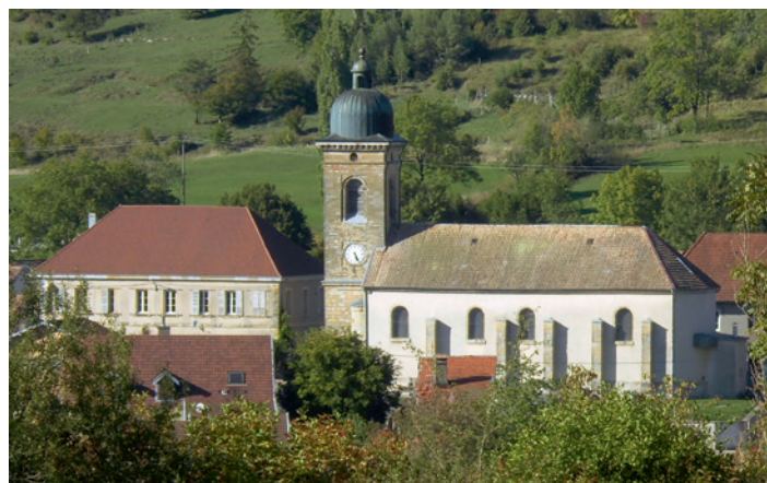
Façade sud de l'église.