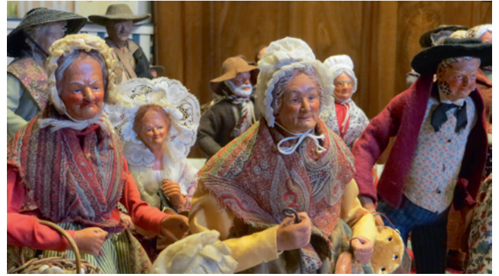
Les santons de Provence

Samedi 15 décembre, dimanche 16 et mercredi 19 à l'église de Foucherans, une centaine de santons costumés à la manière des santons de Provence, joueront la crèche provençale.