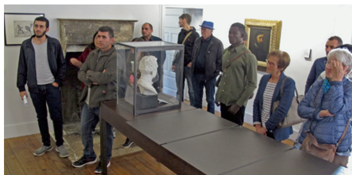
Une journée d'accueil des Migrants par le Musée Courbet et la Ferme de Flagey, dimanche 21 octobre