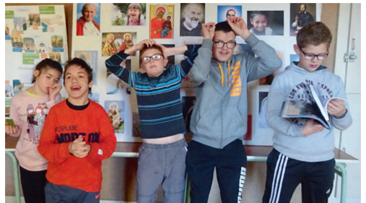
Les enfants de la PCS (catéchèse spécialisée), devant le panneau de la Toussaint.