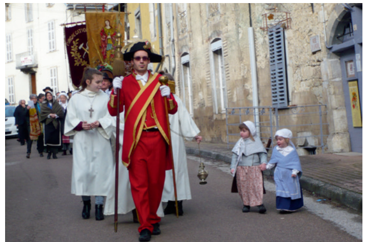
La Saint Vernier 2018 à Lods.

Repas à réserver au 06 08 06 55 47 (attention places limitées).