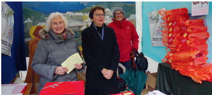
Le stand de la paroisse

Les vitabris se montent au moment de la rédaction de ce bulletin, il nous sera difficile donc de revenir sur le marché de Noël. On peut tout de même citer la proposition faite cette année aux visiteurs de la Maison du "Petit Jésus". Ils ont reçu une boîte cadeau "vide", qu'ils sont invités à remplir, à la façon du calendrier de l'Avent, mais "à l'envers" et "solidaire". Chaque jour, ils y déposeront une offrande de leur choix. Et après? Plusieurs destinations sont possibles: les boîtes peuvent être apportées aux messes de Noël, pour être offertes à Emmaüs, au Secours Catholique, au Casoli (lire ci-contre), ou encore à l'association "Coups de main"; elles peuvent aussi être proposées dans nos villages et nos quartiers à des personnes nécessiteuses. Ayons à cœur d'y penser chaque jour! Un grand MERCI à l'Association Anim'Ornans sans qui ce beau Marché de Noël n'aurait pas lieu; merci à ses bénévoles et à toutes les personnes mobilisées sur les trois journées pour décorer et rendre agréables l'église et le site.