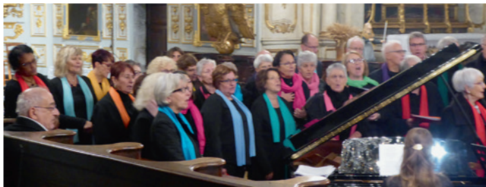
Les chorales Diapason et Jubilate à Ornans le 11 novembre