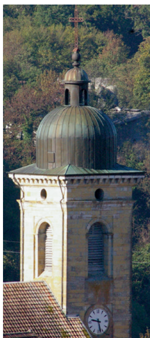
Le clocher construit en 1823, son bulbe actuellement en cuivre et son lanterneau.

Il est assez probable que la commune d'Éternoz ait financé et réalisé seule la construction de cette église. Et c'est seule qu'elle mit en œuvre les travaux complémentaires. Elle le fit après une pause d'une petite vingtaine d'années et se lança tout d'abord dans la construction d'un vrai clocher .