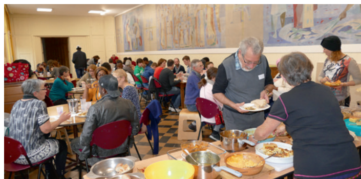
Une journée d'accueil à l'Escale jeunes à Besançon le 10 novembre