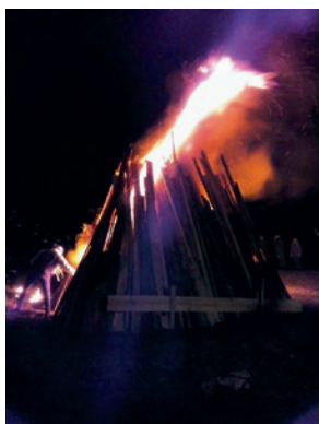
Les Failles 2018.