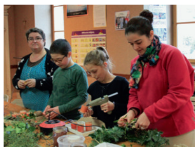
L'atelier décoration pour le marché de Noël