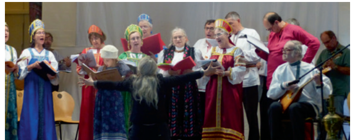
Une chorale russe

La crèche se prolongera en soirée avec le concert de la Chorale russe du Poche-Montparnasse , un chœur tout inspiré de l'âme slave; mélodies populaires, patrimoine de la Russie éternelle. Ce concert est au profit de l'Église de Madagascar.