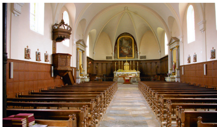
Vue intérieure de l'ensemble de l'église.

Et une église se doit d'être voûtée... (suite au prochain numéro)