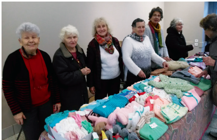
Le stand de tricot 2018.