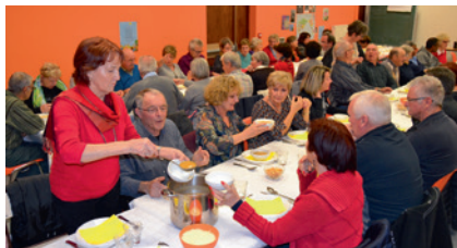
Une soirée réussie rassemblait les chorales du Plateau d'Amancey et des Quatre Monts